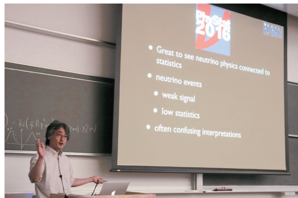
5月30日：カブリIPMUにて開催された国際研究会“PhyStat-v 2016”にて講演（本誌55ページ）。