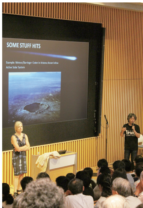
解説をまじえて、参加者のためにランドールさんの講演を日本語逐次通訳。